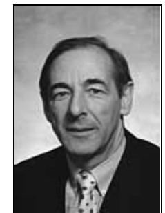
Staatsrat Claude Roch

Mössli Roch scheint ein ganz harter Bursche zu sein. Ungeachtet allfällig anderer Meinungen geht der Erziehungsminister des Staats und der Republik Wallis seinen Weg. Demokratie??? Ach was: „L'état, c'est moi!"