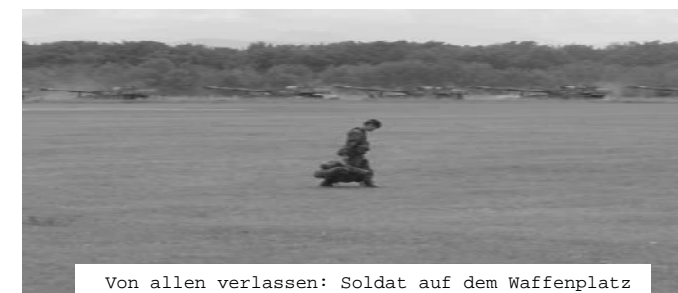
Von allen verlassen: Soldat auf dem Waffenplatz

jetzt geführt, sie ist mit der Frage über die Abschaffung der Armee eng verknüpft. Der Zeitpunkt über eine neue Lancierung einer Armeeabschaffungsinitiative könnte jetzt nicht besser sein. Allerdings hat die GSOA mit ihrer letzten verlorenen Kampagne vor drei Jahren zu viel Pulver verschossen. Deshalb dürfen Parteien wie die JUSO neben einer konstruktiven Diskussion zur Wehrpflicht auf die Forderung nach einer Schweiz ohne Armee nicht verzichten.